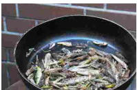
Gli insetti nel piatto